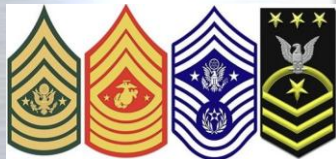
美 육, 해, 공, 해병대 주임원사 계급장