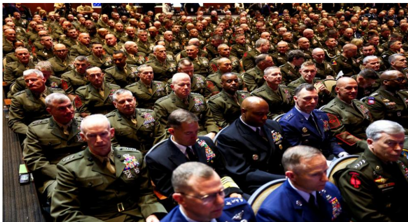
지휘관과 동행한 주임원사(대통령 행사)