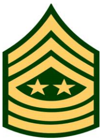
1979년 (육군 주임원사 계급장 제정)