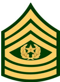
1968년 (주임원사 계급장 제정)