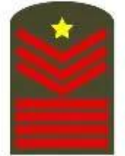
주임상사 계급장 (1989년)

➤ 문화, 역할, 인식에 따른 제도 변경: 인사관리의 효율성 제고, 지휘 계통의 단순화(상명하복 체계 강화), 계급의 숙련도, (미군 제도 수용과 한국 문화의 결합) 잦은 행정소요 부담(진급심사), 계급/직책의 역할 모호(편제), 교육체계 반영 등