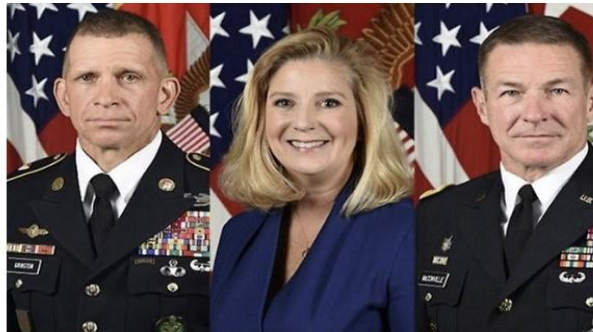
미국 육군의 현 지도부. 왼쪽부터 마이클 그린스톤 주임원사, 크리스틴 워머스 장관, 제임스 맥콘빌 참모총장.

美육군 창설 246주년 맞아 장병들에 서신 주임원사, 참모총장, 장관 순으로 서명해 부사관 예우하는 미군.. 계급장에도 '신경'