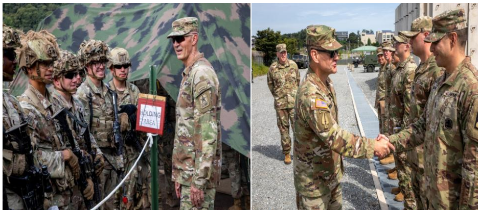
美 육군참모총장/주임원사 활동 모습 (한국 방문, 캠프 험프리스/캠프 케이시. 25년 9월)