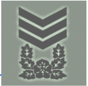
디자인 변경 (무궁화 앞)

❶ 계급장 특이사항: 1989년 일등상사 계급장 상단에 '초승달 관' 부착 시작. 1996년 '무궁화 표지'로 변경되어 정교와 유사한 권위 확보. ❷ 디자인 개정: 1971년(대령 5578호) 병 계급장 위 'V' 형태 추가. 2016년 무궁화 앞 형상을 3단으로 정교화하여 현대적 완성.