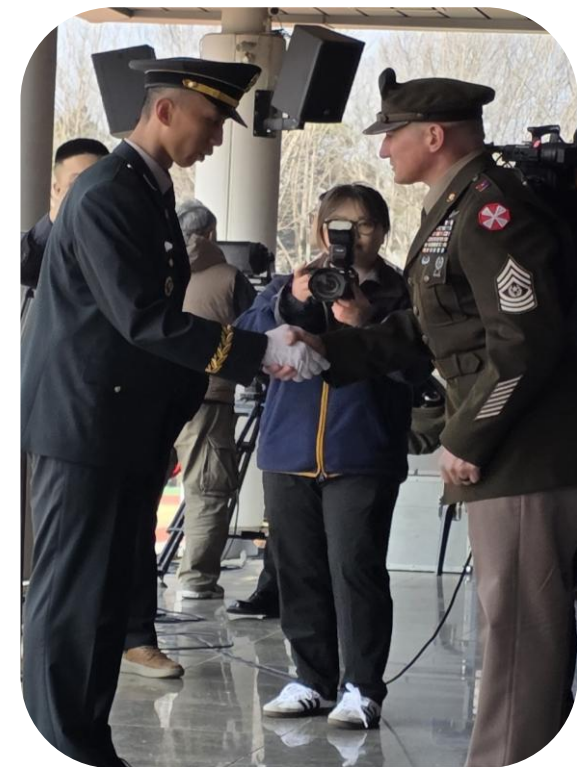
미8군 부사관학교장(원사) 표창 수여 (부사관 임관식)