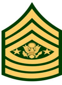
1994년 (육군 주임원사 계급장 변경)