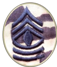
미군 행정보급관 계급장