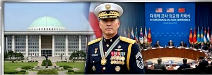
미 합참주임원사 계급장